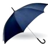
1 an umbrella