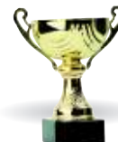
3 ..... trophy